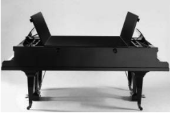
Piano vis-à-vis Pleyel, Paris, 1928