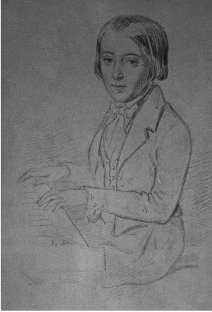
Camille Saint-Saëns à 11 ans, 1846