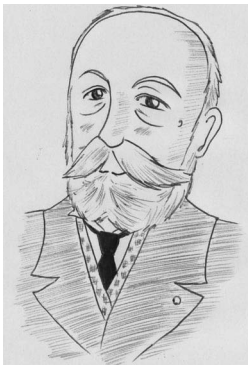
Camille Saint-Saëns

Tout en défendant les œuvres de grands maîtres, Camille compose, enseigne le piano (notamment à Fauré, Duparc ou Chabrier, futurs grands compositeurs), écrit dans les journaux. Il fonde aussi la Société Nationale de Musique qui favorise la diffusion des œuvres de compositeurs français.